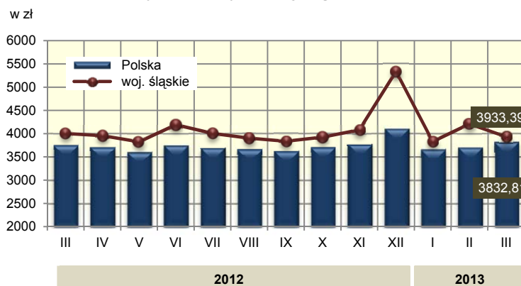
Przeciętne miesięczne wynagrodzenie brutto ab