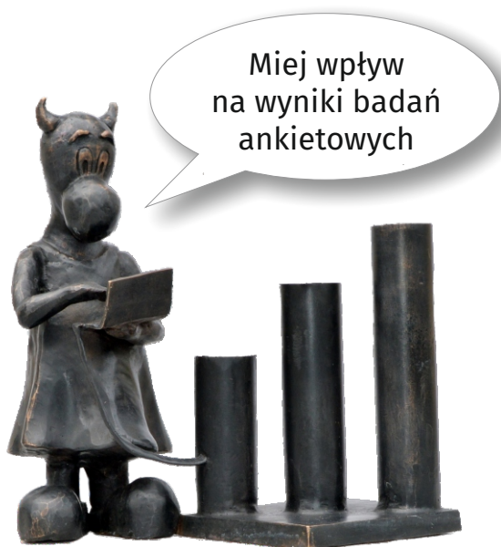
Beboczka „StatUSia” przed siedzibą Urzędu Statystycznego w Katowicach