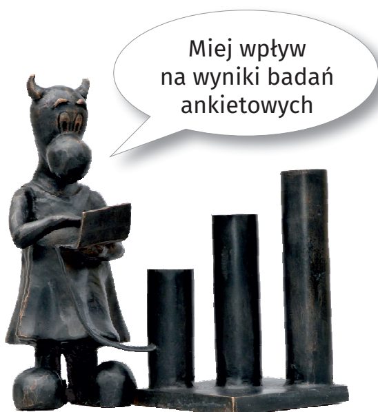
Beboczka „StatUSia” przed siedzibą Urzędu Statystycznego w Katowicach