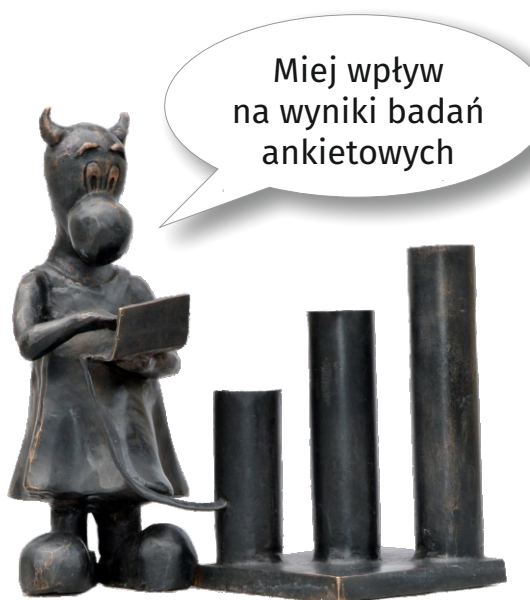
Beboczka „StatUSia” przed siedzibą Urzędu Statystycznego w Katowicach