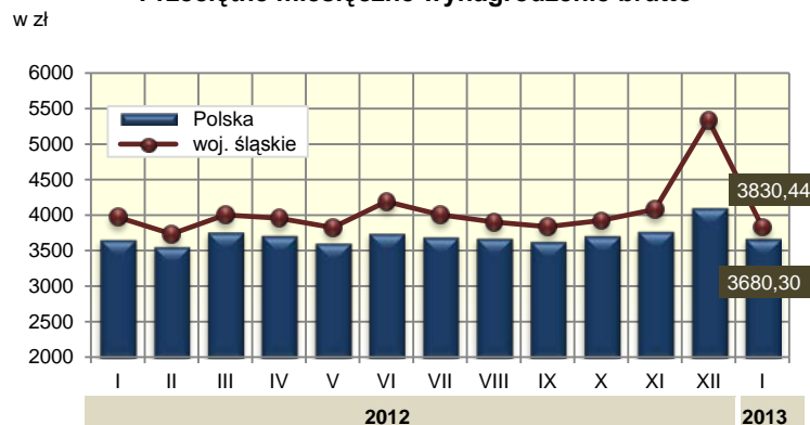
Przeciętne miesięczne wynagrodzenie brutto ab