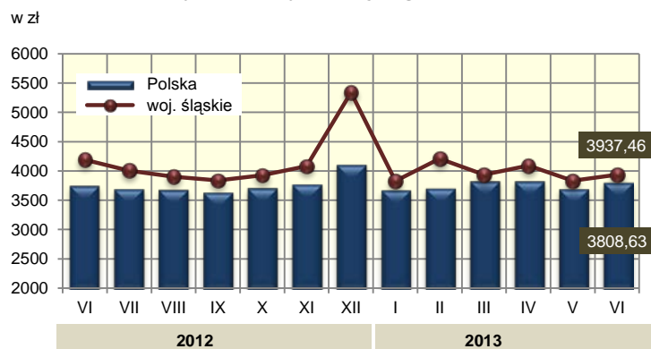
Przeciętne miesięczne wynagrodzenie brutto ab