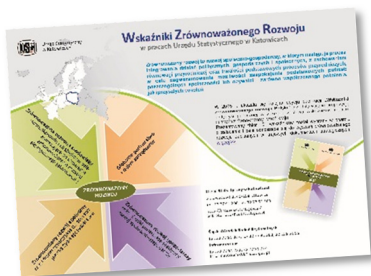
Ulotka „Wskaźniki Zrównoważonego Rozwoju w pracach Urzędu Statystycznego w Katowicach”